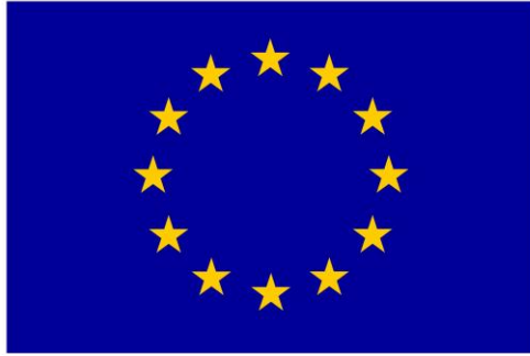
Euroopa Liit Euroopa Sotsiaalfond